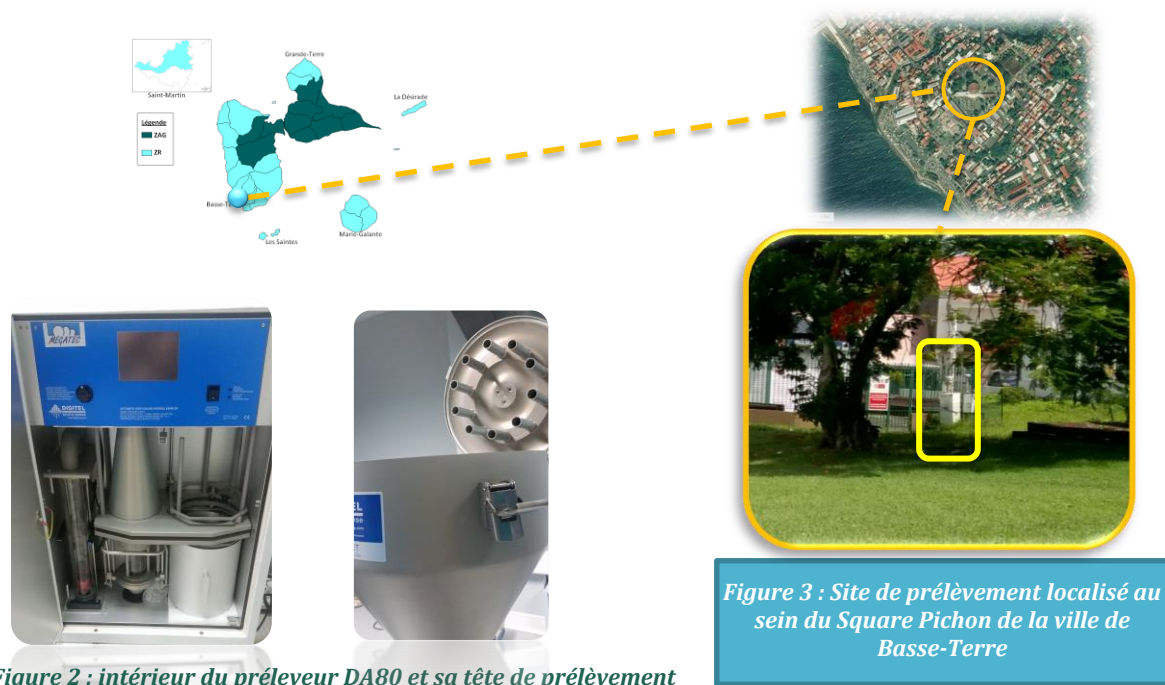
Figure 3 : Site de prélèvement localisé au sein du Square Pichon de la ville de Basse-Terre