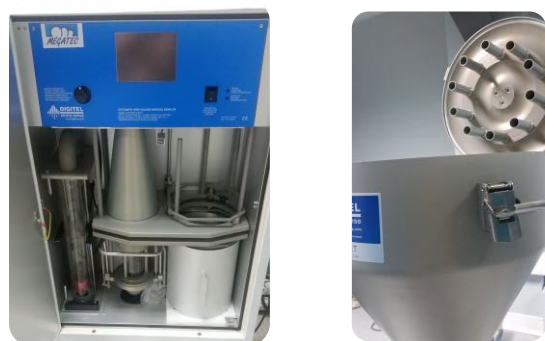
Figure 2 : intérieur du préleveur DA80 et sa tête de prélèvement