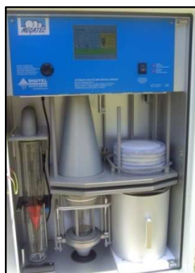
Intérieur du DA80