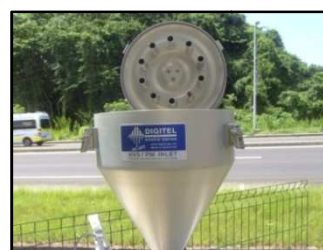
Tête de prélèvement